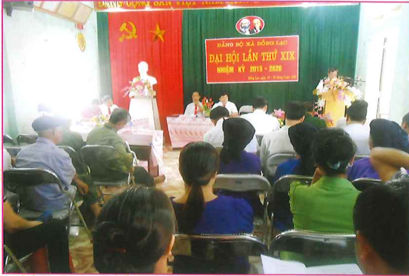
Đại hội Đảng bộ xã Đồng Lạc (nhiệm kỳ 2015-2020)