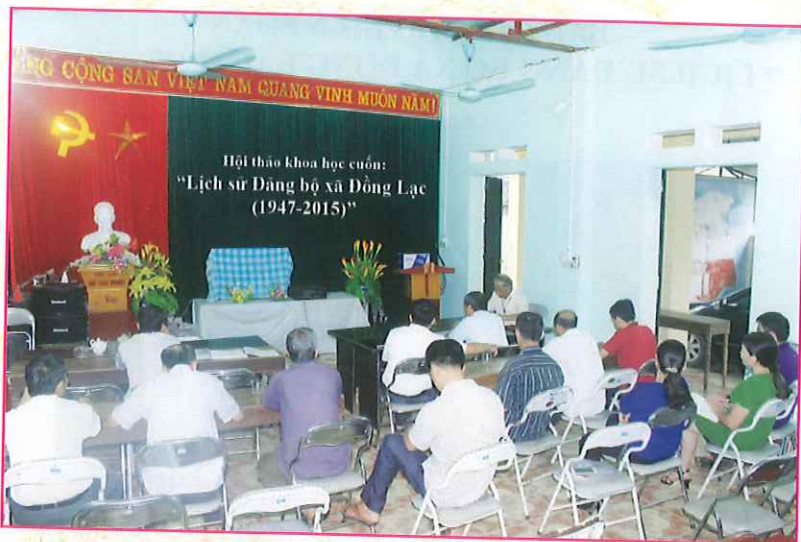
Hội thảo khoa học cuốn: "Lịch sử Đảng bộ xã Đồng Lạc (1947-2015)"