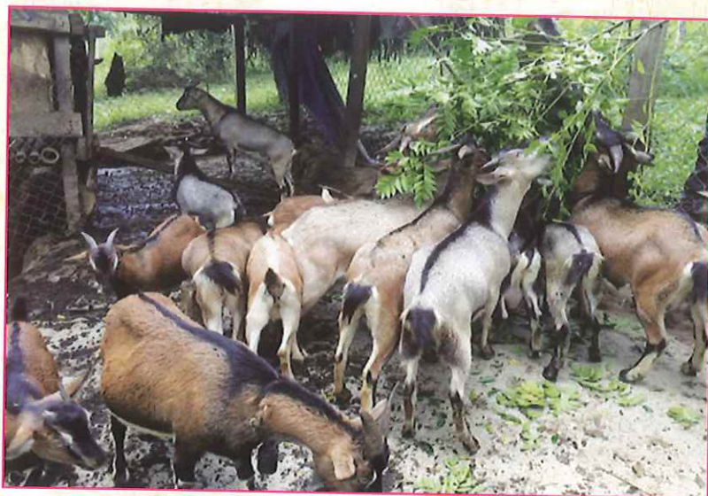
Mô hình nuôi dê ở xã Đồng Lạc