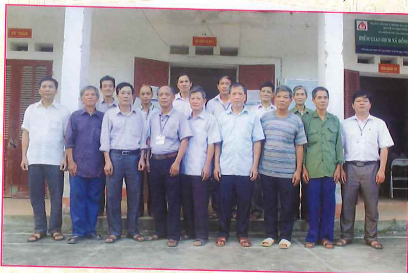
Các đại biểu tham dự Hội thảo khoa học cuốn: "Lịch sử Đảng bộ xã Đồng Lạc (1947-2015)" chụp ảnh lưu niệm