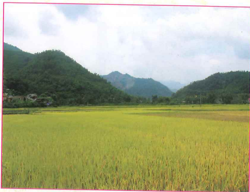
Cánh đồng lúa xã Đồng Lạc