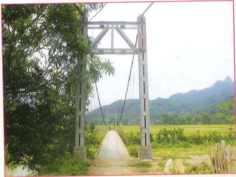
Cầu treo Thôn Phá, xã Đồng Lạc