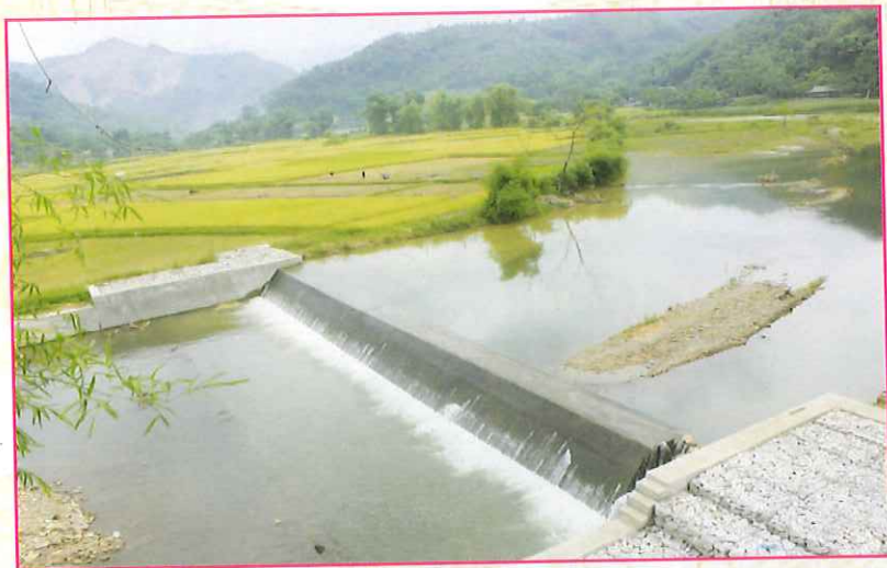
Đập Vàng Thảm, xã Đồng Lạc