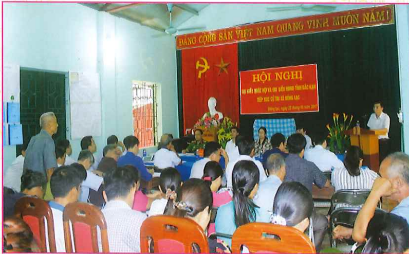
Hội nghị Đại biểu Quốc hội và Đại biểu Hội đồng nhân dân tỉnh Bắc Kạn tiếp xúc cử tri xã Đồng Lạc ngày 22-6-2017