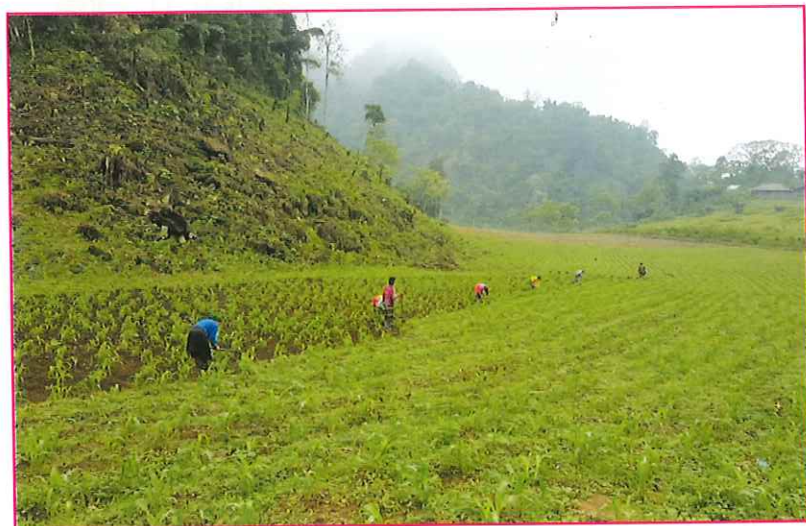
Đời sống sản xuất thường nhật của người H'Mông, xã Xuân Lạc