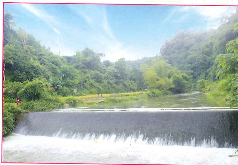
Đập thôn BảnTURN, xã Xuân Lạc