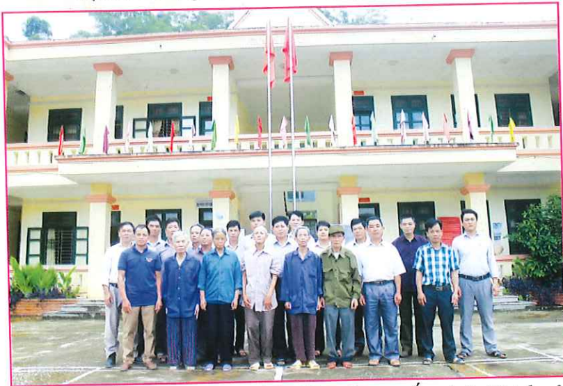
Các đại biểu tham dự Hội thảo khoa học cuốn sách: "Lịch sử Đảng bộ xã Xuân Lạc (1930 - 2015)" chụp ảnh lưu niệm