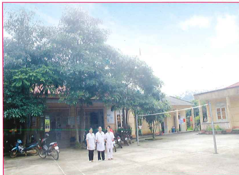
Trạm Y tế xã Xuân Lạc