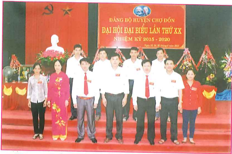
Các đại biểu xã Xuân Lạc tham dự Đại hội Đại biểu Đảng bộ huyện Chợ Đồn lần thứ XX (nhiệm kỳ 2015 - 2020)