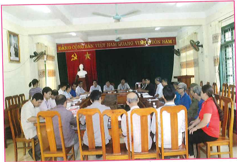
Hội thảo khoa học cuốn sách: "Lịch sử Đảng bộ xã Xuân Lạc (1930 - 2015)"