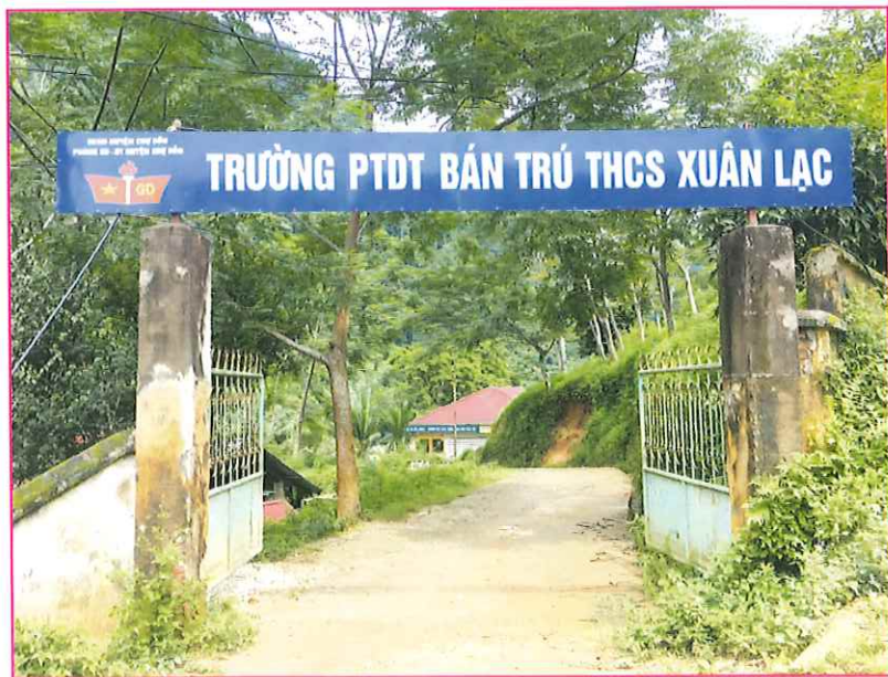
Trường PTDT Bán trú Trung học cơ sở Xuân Lạc