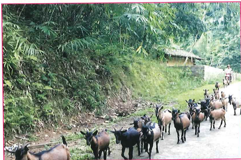
Đàn dê được chăn thả tại xã Xuân Lạc