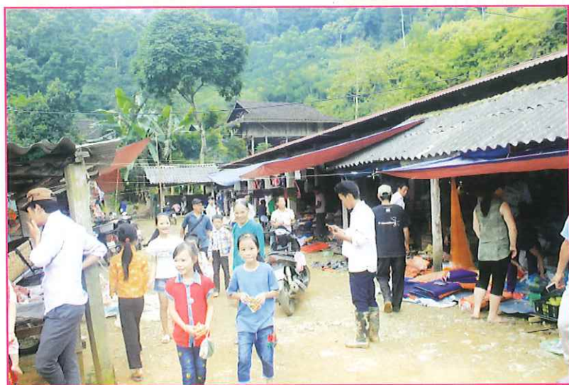
Một góc chợ phiên xã Xuân Lạc