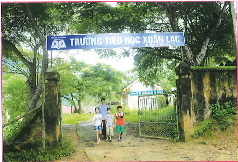
Trường Tiểu học xã Xuân Lạc