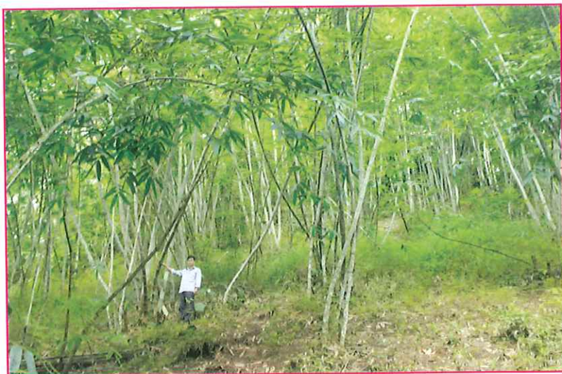
Mô hình trồng măng đạt hiệu quả kinh tế xã Xuân Lạc