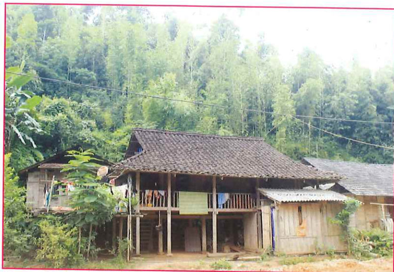
Nhà sàn truyền thống của người Tày, xã Xuân Lạc