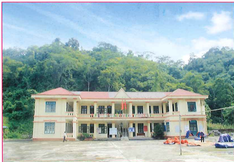
Trụ sở Đảng ủy - HĐND - UBND xã Xuân Lạc