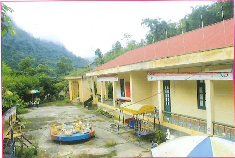
Trường Mầm non xã Xuân Lạc