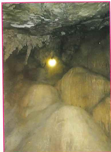
Di tích hang Nghiến (Bản Ó, xã Xuân Lạc)