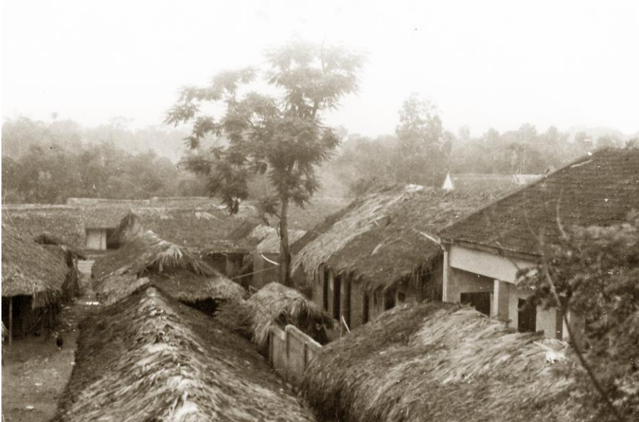
Quán Ông Già (xã Minh Tiến) là trạm liên lạc của cán bộ cách mạng khi vào ATK Định Hóa trong thời kỳ kháng chiến chống Pháp