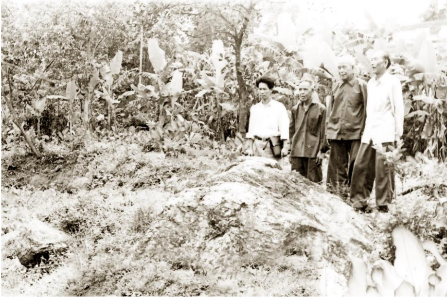
Địa điểm xóm Đồng Cả, xã Hùng Sơn (nay là thị trấn Hùng Sơn) là nơi làm việc của Ủy ban châu Giải Phóng Đại Từ năm 1945