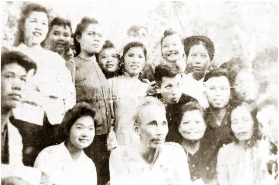
Chủ tịch Hồ Chí Minh dự Đại hội Phụ nữ toàn quốc lần thứ nhất tại Phú Xuyên (tháng 4/1950)