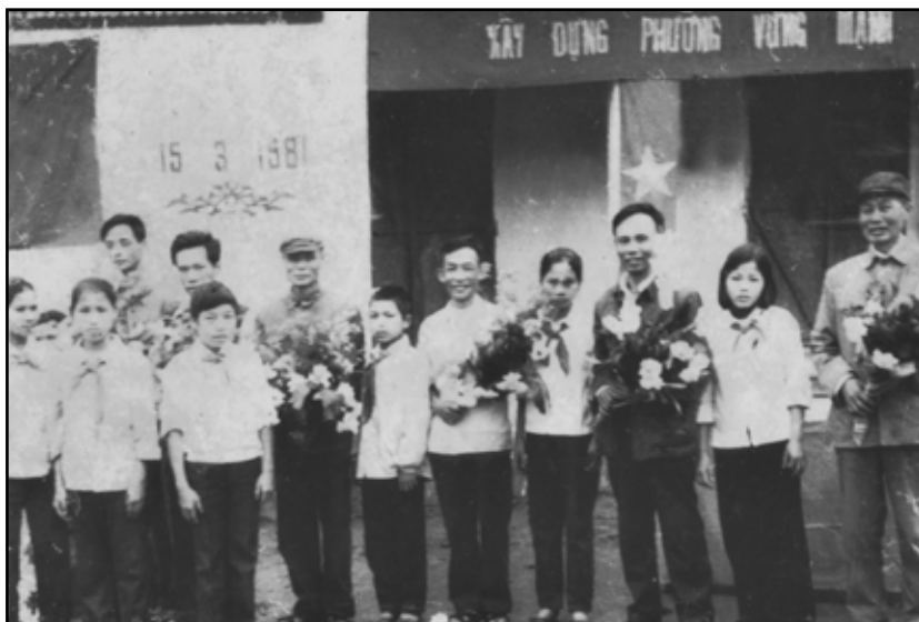
Các đồng chí Ủy viên UBND phường khóa I (1981 - 1985) chụp ảnh ngày công bố quyết định đổi tên tiểu khu Tân Long thành phường Tân Long (15/3/1981)

Khi đã ổn định về tổ chức, Đảng ủy, Ủy ban nhân dân phường Tân Long đã tập trung lãnh đạo thực hiện nhiệm vụ phát triển kinh tế - xã hội, đặc biệt là chỉ đạo thực hiện Chỉ thị số 100-CT/TW (gọi tắt là Khoản 100), ngày 13/1/1981 của Ban Bí thư Trung ương Đảng về “ Cải tiến công tác khoán, mở rộng “khoán sản phẩm đến nhóm lao động và người lao động” trong hợp tác xã nông nghiệp ”. Chỉ thị nêu rõ mục đích của việc tiến hành khoán sản phẩm là nhằm kích thích tăng năng suất lao động, tăng tích lũy của hợp tác xã, củng cố tăng cường quan hệ sản xuất ở nông thôn, nâng cao thu nhập và đời sống của xã viên.