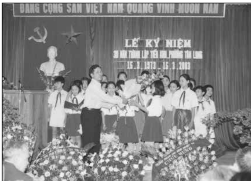
Lễ kỷ niệm 30 năm thành lập tiểu khu - phường Tân Long (1973 - 2003)

xếp, tổ chức lại tổ dân phố, bỏ cấp phố, Đảng bộ phường Tân Long đã chỉ đạo Ủy ban nhân dân, các cấp ủy chi bộ thảo luận, phân chia, rút gọn lại tổ nhân dân, từ 39 tổ xuống còn 20 tổ 1 . Thông qua việc chia lại tổ dân phố, các chi bộ cũng được sắp xếp lại theo tổ dân phố, mỗi tổ dân phố có 1 chi bộ lãnh đạo. Như vậy, sau khi chia tách, kiện toàn lại, Đảng bộ có 25 chi bộ trực thuộc (20 chi bộ dân phố, 3 chi bộ nhà trường, 1 chi bộ công an và 1 chi bộ cơ quan).